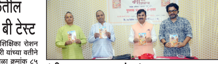
'मी माझ्या माणसांचा' पुस्तक प्रकाशन

भुरट्या चोऱ्यांमध्ये वाढ नाशिक :- जेलरोड परिसरातील कॅनलरोड, मंगलमूर्तीनगर, लोखंडे मळा, नारायणबापूनगर, शिवाजीनगर आदी परिसरात भुरट्या चोऱ्यांमध्ये वाढ झाली आहे.