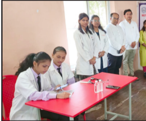
सातपूर (भ्रमर प्रतिनिधी)

सातपूर (भ्रमर प्रतिनिधी) :- मोतीवाला होमिओपॅथिक मेडिकल कॉलेज व हॉस्पिटल व स्व. पैलवान सुकदेव नागरे प्रतिष्ठानच्या संयुक्त विद्यमाने शालेय विद्यार्थ्यांसाठी आरोग्य तपासणी शिबिराचे आयोजन मॉडर्न एज्युकेशन सोसायटी माध्यमिक विद्यालय, अशोकनगर येथे करण्यात आले होते.