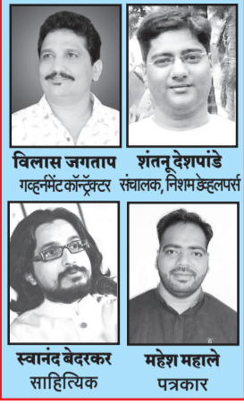
विलास जंगताप गुरुदिवस, शनिवार, दि. २८ मार्च २०२६