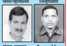
केलस दबने माजी मुद्रक जिल्हाधिकारी